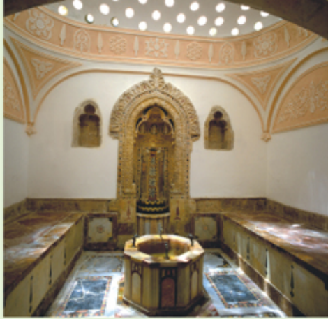
صالة الحمام الباردة

وسقفه بالمنقوشات والفسيفساءات المرمرية المتعددة الالوان، ناهيك عن الآيات الحكيمية المرقومة عليها.