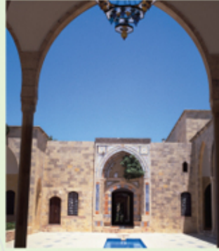
قصر الأمير أمين

في جوار القصر عدد من المطاعم والمقاهي، وفي البلدة محلات لشراء بعض المصنوعات الحرفية التراثية. وبالإضافة إلى فندق «قصر المير أمين»، يمكن للزائر ان يجد له مكانا في احد فنادق «بعقلين» على بعد سبعة كيلومترات من بيت الدين. حاليا القصر مقر صيفي لرئاسة الجمهورية وهناك عدة قاعات واجنحة مخصصة لاستقبال الوفود.