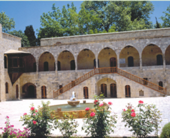
واجهة دار الكنية

يقضي الرواق المعقود الى باحة مستطيلة الشكل يتوسطها حوض ماء وتحيط بها الأروقة من جهات ثلاث، فيما تفتح الجهة الرابعة على الوادي. وعلى زاويتي أحد الأروقة شرفتان من الخشب المطعم والمزخرف لمكانان من بداخلهما من مراقبة ما يجري في الخارج من دون ان يراه احد. ويطل جناح الوزير على هذه الباحة من زاويتها الجنوبية الغربية، فيما يحدها من الجهة الشمالية الشرقية جناح كان مخصصا لموظفي القصر، يعرف باسم «دار الكنية» (١١).