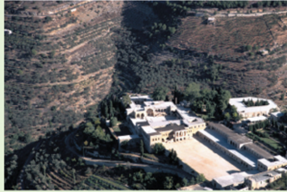
منظر جوي للقصر

المضافة: وعلى طول الميدان الشمالي يقوم جناح من طبقتين، يعرف بـ «المضافة». ويتألف طابقه الأرضي من غرف معقودة كانت تستعمل كاسطبلات، فيما يتألف طابقه العلوي من قاعات وغرف كانت في الأصل معدة لإستقبال ضيوف القصر. وتطل هذه الغرف على الميدان من خلال رواق مسقوف. وكانت أصول الضيافة في تلك الأيام تقضي بأن يستقبل القصر جميع زواره لمدة ثلاثة ايام دونما حاجة الى التعريف عن أنفسهم. وقد جرى ترميم هذا الطابق الذي يصعد اليه بدرج (٤) عام ١٩٤٥ بالاستناد الى وثائق وصور قديمة. وحتى عشية الحرب اللبنانية، كان يضم متحفا هاما يحتوي متاعاً والبسة وأسلحة تمثل بعض أوجه الحياة اللبنانية في عصر الاقطاع، ثم أضيفت الى هذا المتحف مجموعات من القطع الأثرية وأطلق عليه إسم «متحف رشيد كرامي» (٥). ويضم المتحف اليوم مجموعات من الفخاريات التي تعود الى عصري البرونز والحديد وخرى من الزجاجيات الرومانية بالإضافة الى مجموعات من الخلى الذهبية والنواويس الرصاصية الرومانية